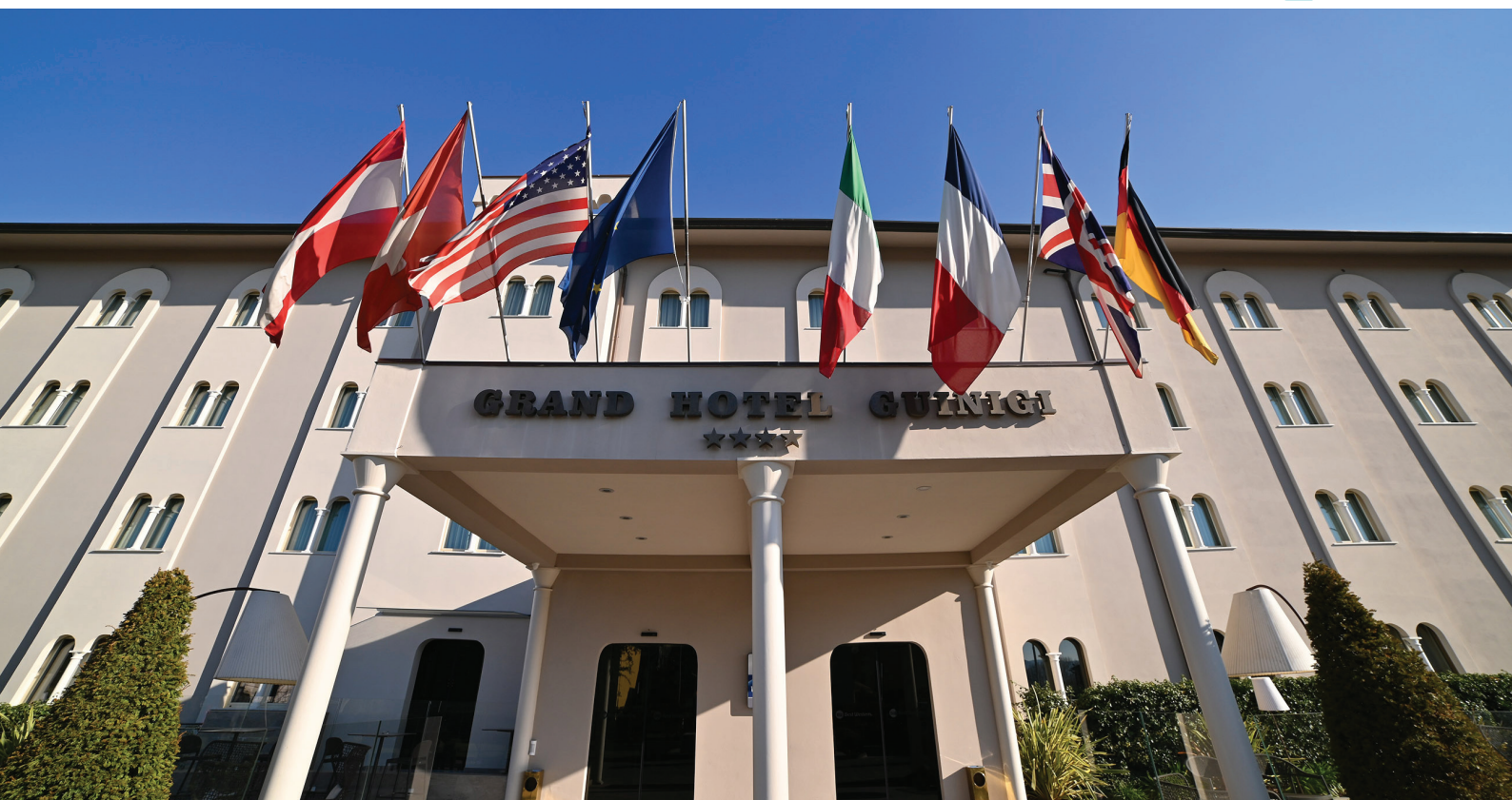
Best Western Grand Hotel Guinigi, Lucca