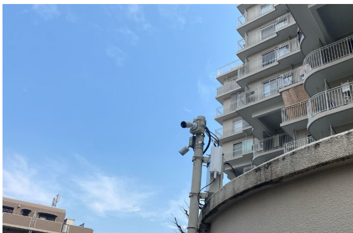
敷地内を監視する「InSight S345」

合計約 35 台の監視カメラを導入し、広大な敷地の効率的な監視を実現されました。4 MP の高画素カメラを建物の出入口や屋外の駐車場エリアなどに設置し、今までは確認が困難であった車のナンバープレートや、出入りする人の顔など細部まで確認できるようになり、セキュリティが強化したことはもちろん画質が向上したことにより警備員の負担を軽減することに成功しました。さらに、今回は LAN 配線の引き直しをせずに屋外対応の Wi-Fi 6 アクセスポイントで通信をすることにより、屋外の長距離配線に関わる費用を大幅なコストダウンを実現しました。