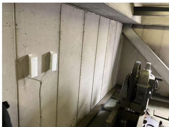
エレベーターのネットワークを構築した「EAP215-Bridge KIT」

また、エレベーターシャフトの天井部分と各エレベーター内には、「EAP215-Bridge KIT」を導入し、最大 5km の長距離通信が可能なポイントツーポイント構成のワイヤレスネットワークを構築。これにより、多層階で稼働するエレベーター内でも、安定した高速通信を実現しました。配線が困難な環境でも確実な接続を維持でき、配線工事や保守にかかるコストの大幅削減にも成功しています。