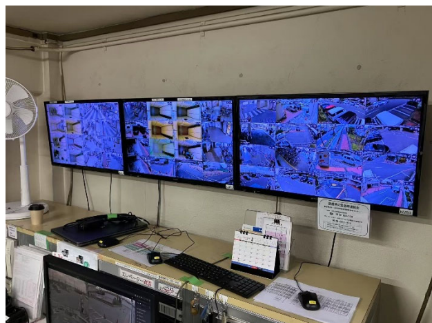
24 時間体制で安全管理をする守衛室