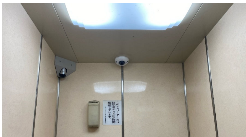
エレベーター内の「VIGI C230I Mini」